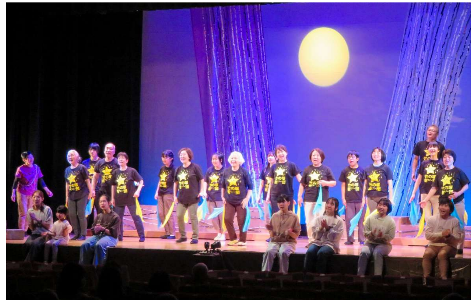
2023年3月に開催した「竹の塚劇団第11回公演 わたしのヒロシマものがたり」の様子