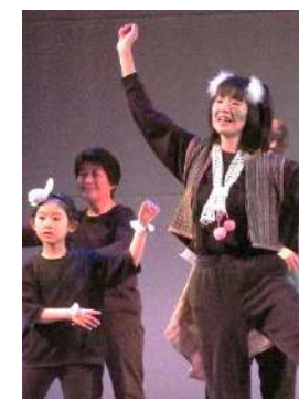
▲第13回公演「貝の火のうた」より 個々の見せ場にも注目してください！