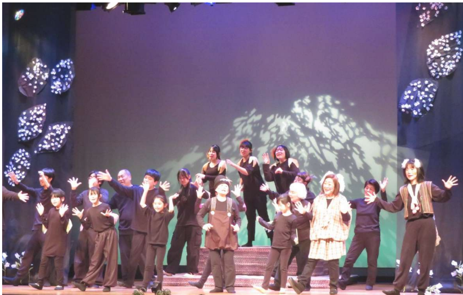
2025年3月に開催した「竹の塚劇団第13回公演 貝の火のうた」の様子